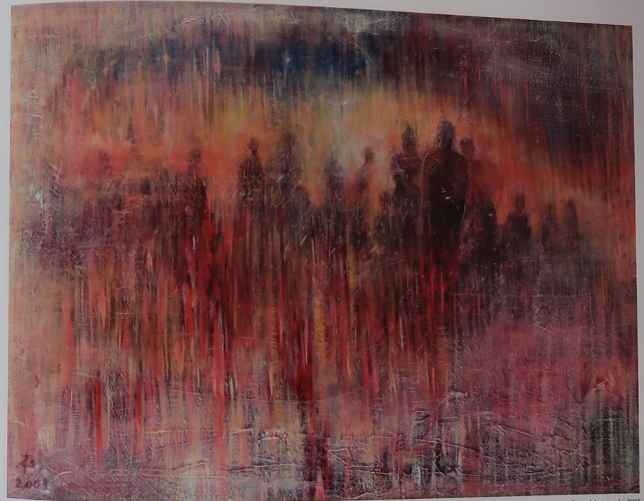
Cesta z labyrintu, olej, 2003