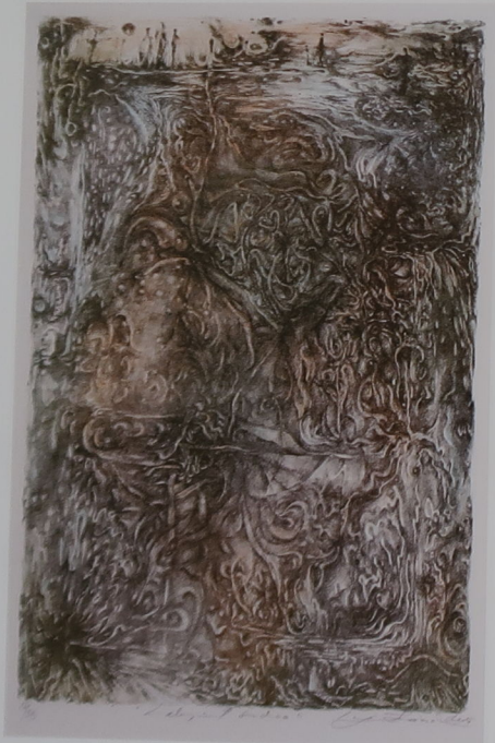
Labyrint srdca, litografia, 2004

Narodila sa 4. 2. 1958 v Bratislave. V posledných rokoch sa často zdržiava v Novom Meste nad Váhom a jeho okolí. Študovala na Strednej škole umeleckopriemyselnej v Bratislave (1973 - 1977), na oddelení výstavníctva a aranžérstva u profesora Rudolfa Filu. V rokoch 1997 - 1983 pokračovala v štúdiách na Vyskej škole výtvarných umení v Bratislave, na oddelení knižnej tvorby a ilustrácie u profesora Albina Brunovského. Tvorí a žije v Bratislave. Venuje sa maľbe, knižnej ilustrácii, grafike a vitráži. Vo svojej sugestívnej, krajinársko - figuratívnej tvorbe, komponovanej do poeticko - meditatívnych kompozícií, hľadá odpovede na základné otázky života. V jej dielach zohráva rozhodujúcu úlohu najmä pôsobenie svetla a tmená farebnosť, čím ich zahŕňa do akéhosi atmosférického chvenia a nedefinovateľného imaginatívneho prostredia.